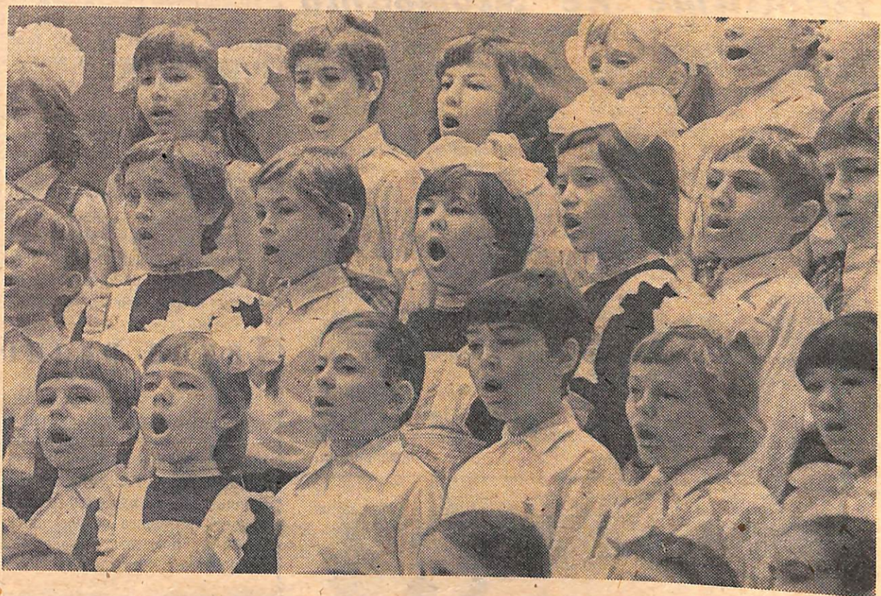
На снимках: самый волнующий момент — начало концерта.

Незабываемы поездки в Эстонию на праздник песни. Многие выпускники могут поделиться воспоминаниями об увиденном и услышанном там. Вместе с песней мы приучались трудиться. Летом часто ездили в лагерь труда и отдыха, где после работы выступали с концертами. Занятия в хоре помогали нам в учебе, способствовали развитию кругозора. Но самое главное, студия помогла нам стать добрыми и честными людьми. От имени выпускников нам хо-